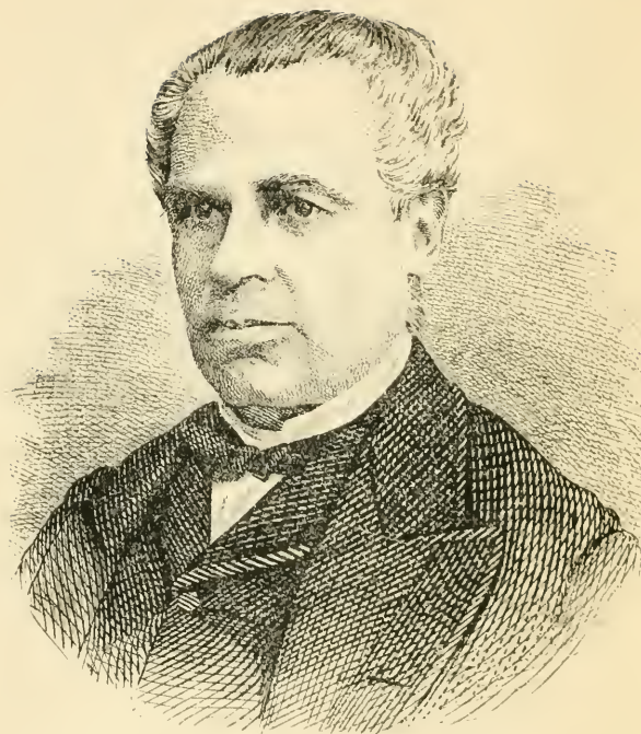
SIR GEORGE-ETIENNE CARTIER.